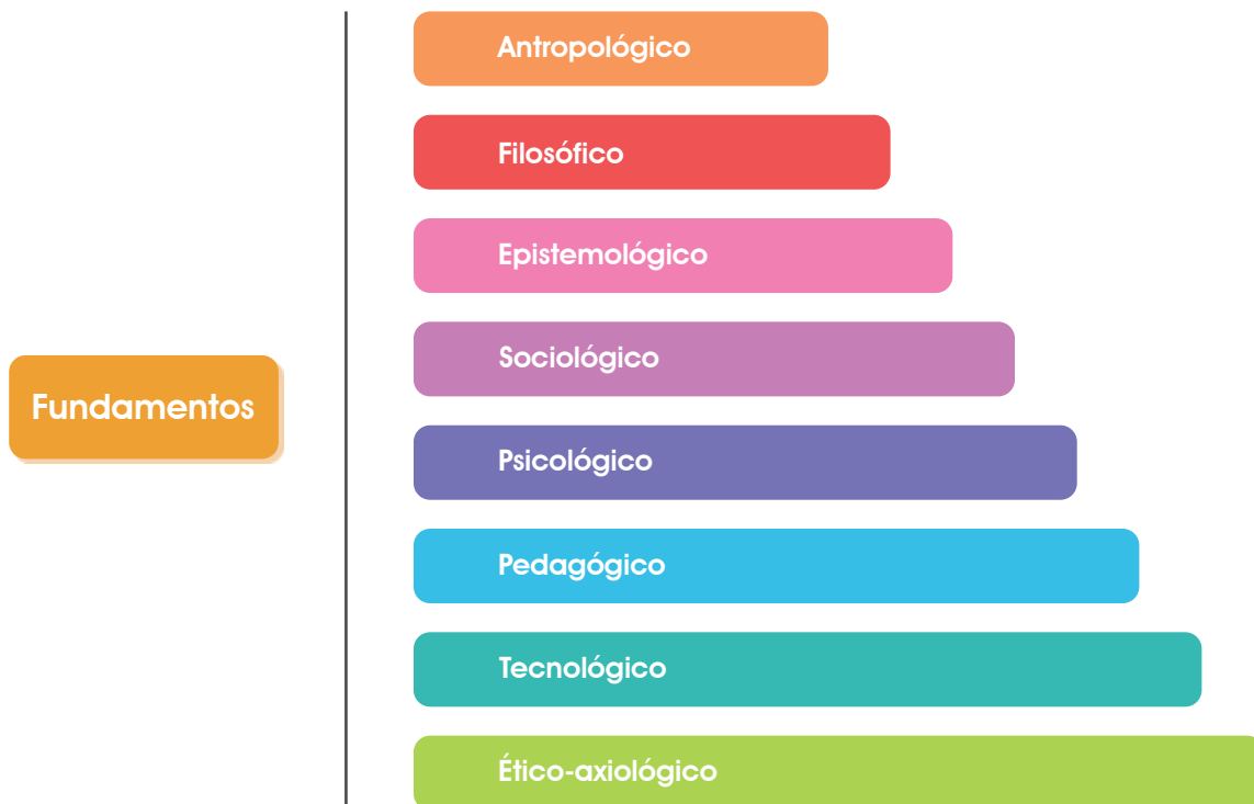
Gráfica 2. Fundamentos del Currículo en la UDI