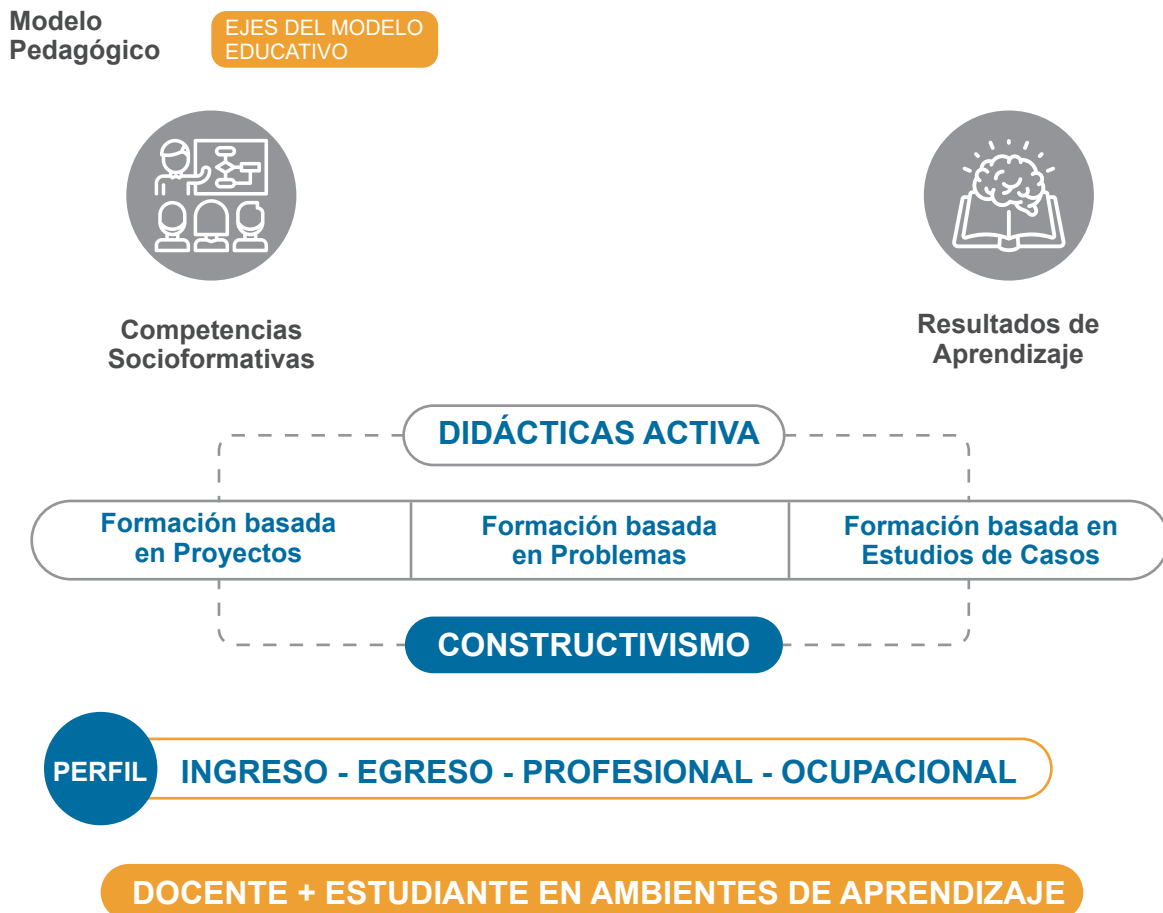
Gráfica 3. Modelo Pedagógico UDI